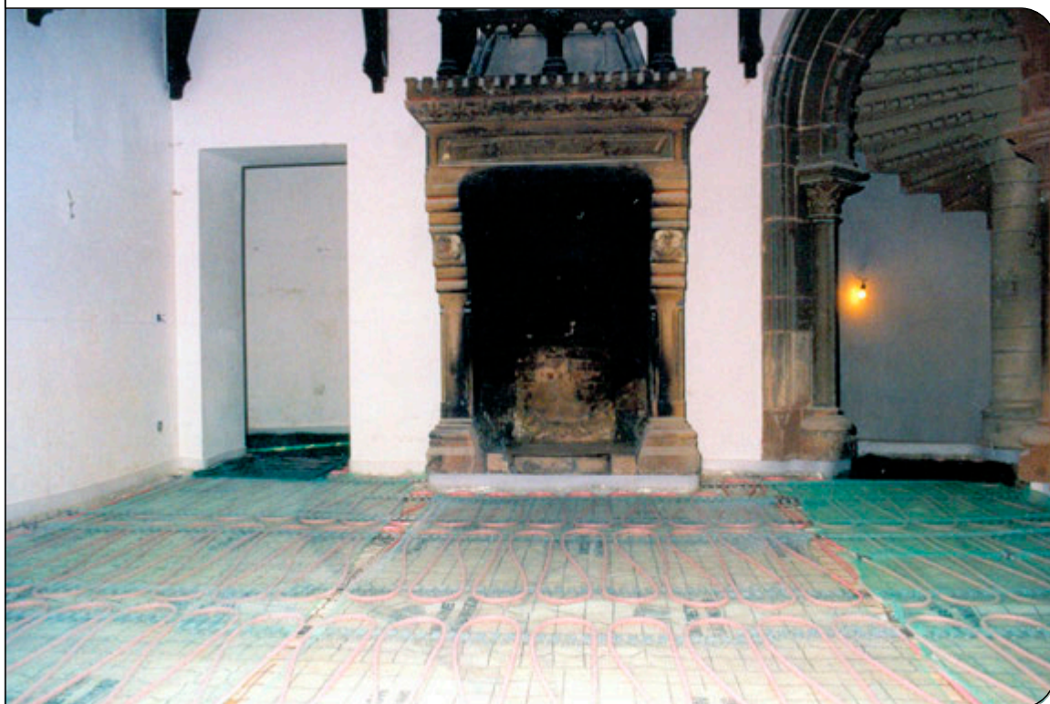
Neue Fußbodenheizung vor altem Kamin