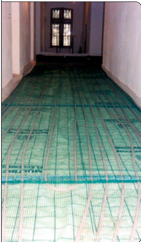
MB-System mit Niederhaltenetz für die Fließestrichverlegung vorbereitet

In bester Lage direkt am Rhein steht in Bonn-Bad Godesberg die neugotische Villa Cahn. Das denkmalgeschützte schlossähnliche Gebäude, 1868-70 nach Plänen von Edwin Oppler für den Bankier Albert Cahn gebaut, blieb seit 1979 dem Verfall überlassen, bis ein neuer Eigentümer das etwa 10.000 m 2 große Gelände übernahm und die umfangreichen Renovierungsarbeiten in Auftrag gab.