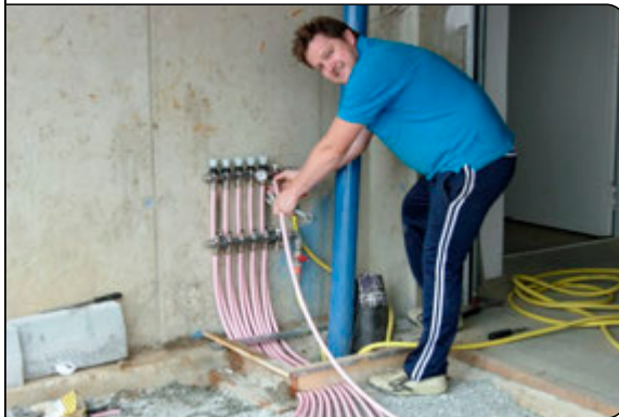
Anschluss der Heizrohre an den Verteiler